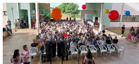
Figura 5. Foto da abertura do evento “IFMS Por Elas

Houve diversas palestrantes mulheres e oficinas organizadas por professoras estimuladas pelo evento e, com isso, serviram de exemplo para diversas meninas do campus , que lotaram o espaço utilizado pelo Damas Literárias para a realização da roda de leitura do dia.