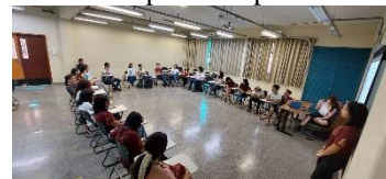
Figura 2. Foto de uma das rodas de leitura

As obras, bem como a biografia das autoras, eram analisadas em rodas de leitura quinzenais realizadas na instituição. Todas as sessões foram mediadas pelas alunas bolsistas, que trabalhavam como mediadoras de leitura e eram responsáveis por organizar a roda, bem como o material utilizado. Ao fim de cada roda de leitura, os participantes eram convidados a escrever algum tipo de texto autoral baseado na autora discutida ou em sua obra para compor o e-book.