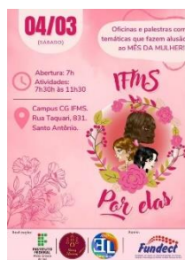
Figura 3. Banner do evento “IFMS Por Elas”

Outra meta alcançada foi a realização do evento “IFMS Por Elas” em homenagem ao Dia Internacional da Mulher, coordenado por nós e pelo projeto “Arco Literário”.